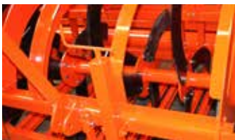
Beluchtermessen bevestigd met breekbouten