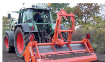
Option : Élévateur monté sur le dessus