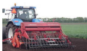
Combinaison d'un semoir et d'un élévateur monté sur le dessus