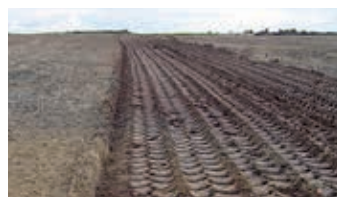
Le rouleau à pneus améliore la gestion des eaux souterraines