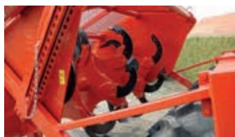
Lames à bêcher spécialement conçues