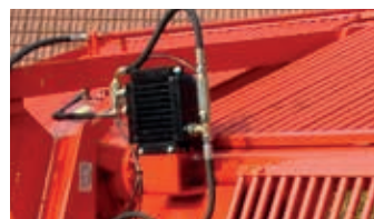
Option : Refroidissement à huile dans la boîte de transmission