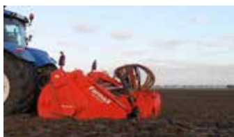
Tot 50 centimeter werkdiepte