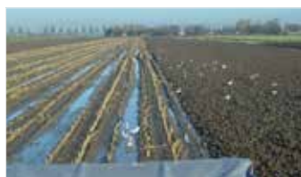
Spitten onder alle omstandigheden