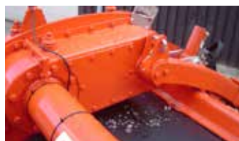
Tussenaandrijving voor smalle transportbreedte