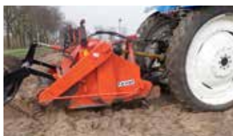
Optie: Hydraulische verstelling