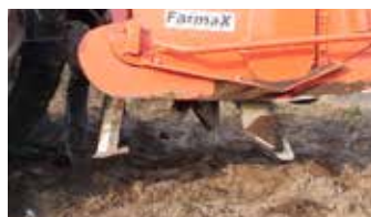
Spitdiepte max. 45 centimeter