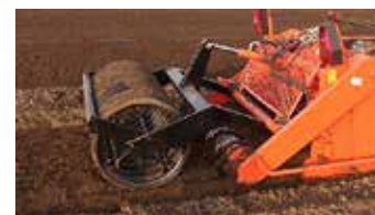
Optie: Extra tweede rol voor een vaster zaai- of plantbed