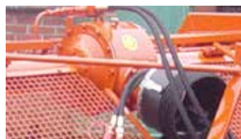
Aandrijfbak met differentieel